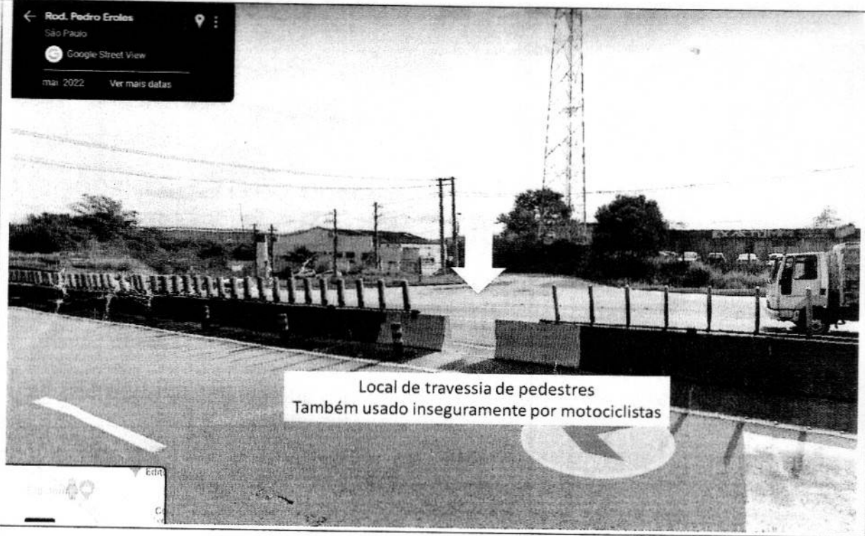
Imagem 01 Local de travessia de pedestres atual

A handwritten signature in black ink, consisting of a stylized name followed by a horizontal line.